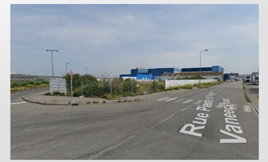
Plan de Masse (Voisinage des 110 m)